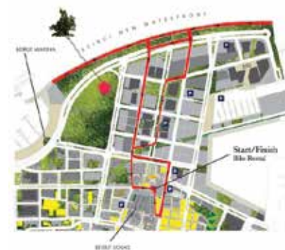
Front de mer de Beyrouth